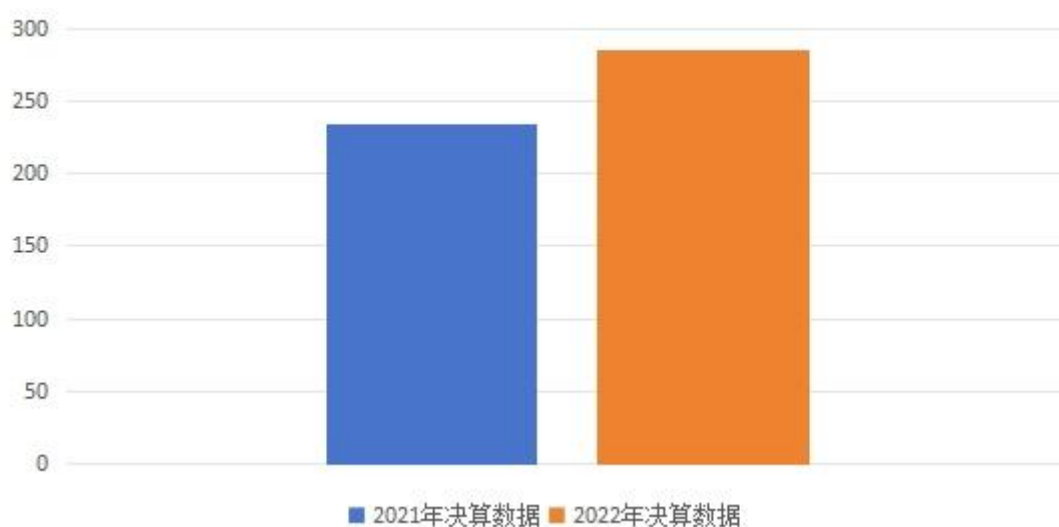
收入支出决算总体情况

2022 年度收入总计、支出总计均为 285.57 万元，与上年相比收、支总计增加 51.23 万元，增长 21.86%。主要是人员经费收支增加。