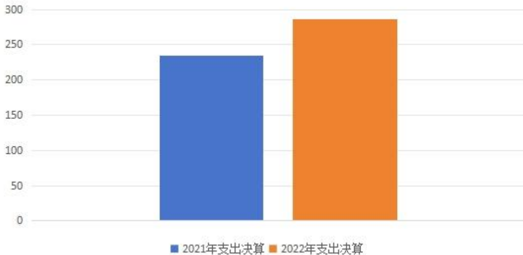
财政拨款收入支出决算总体情况

与上年相比收入总计、支出总计各增加 51.23 万元，增长 21.86%。主要原因是人员经费收支增加。